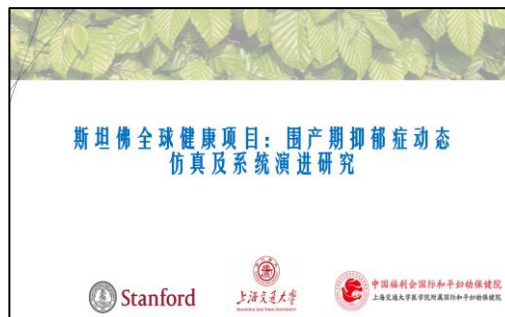
与斯坦福大学前期全球健康合作项目

7. 前期经验： 前期与斯坦福大学 (Stanford University) 开展全球健康项目的合作。