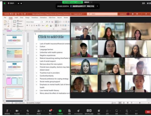
与斯坦福大学开展全球健康 COIL I